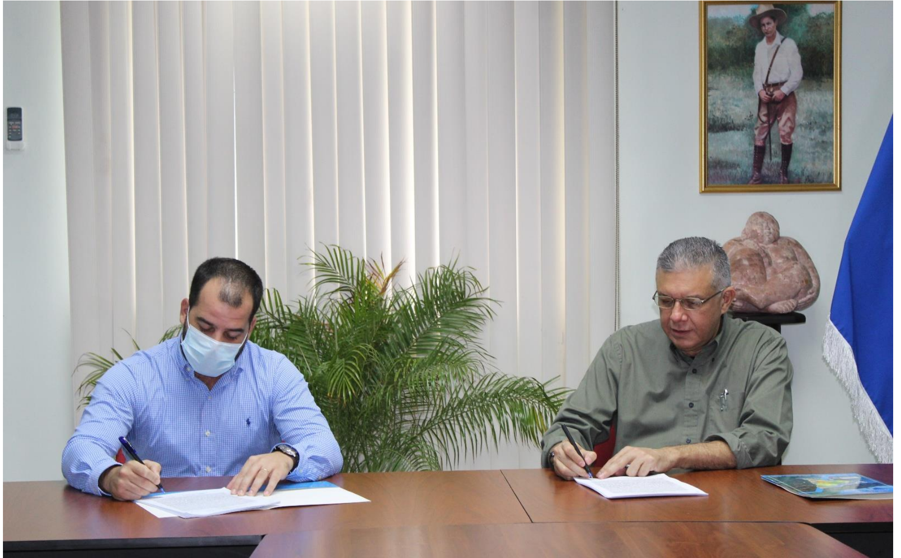
Firma de contrato.