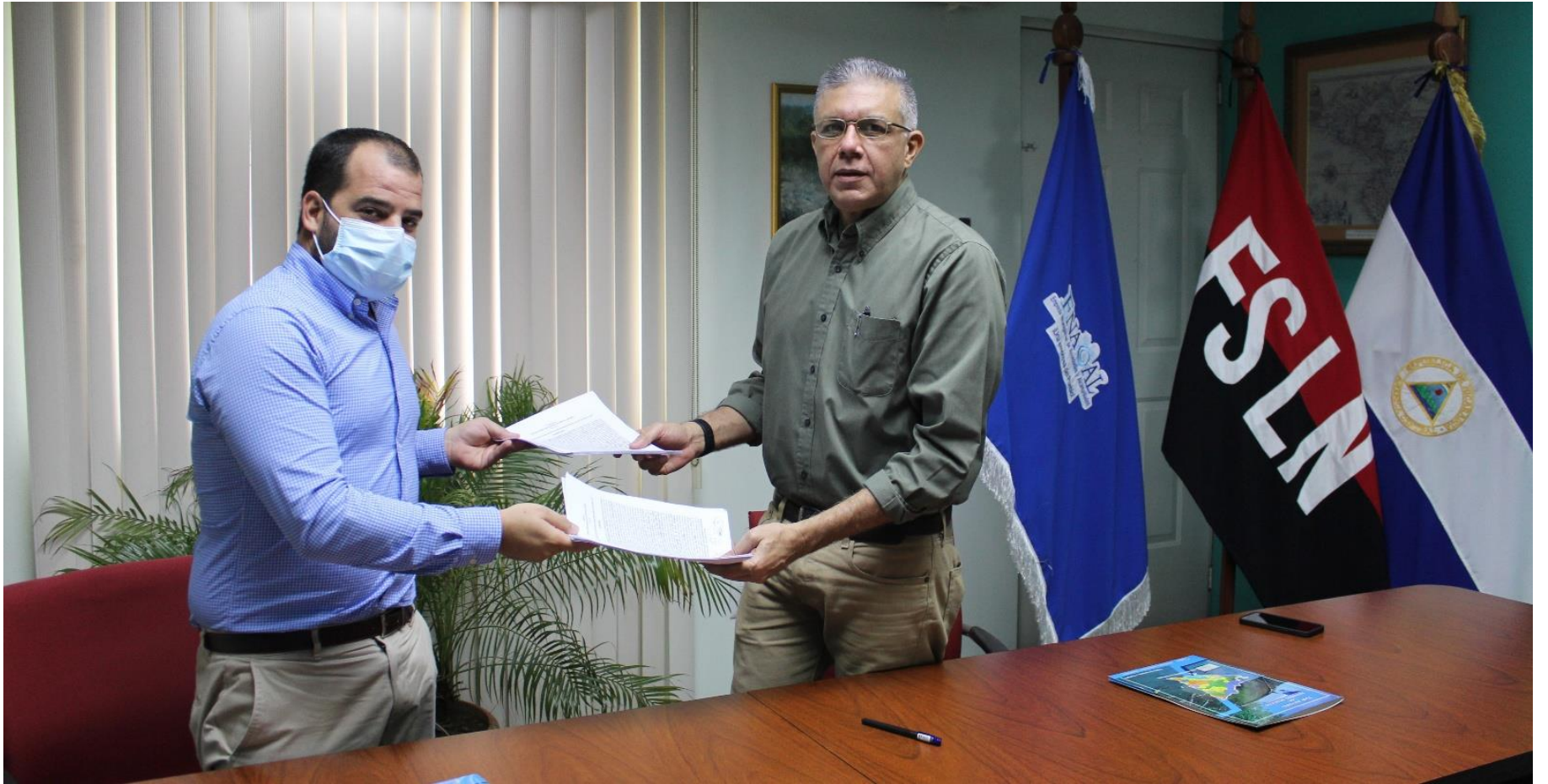
Intercambio de contratos.