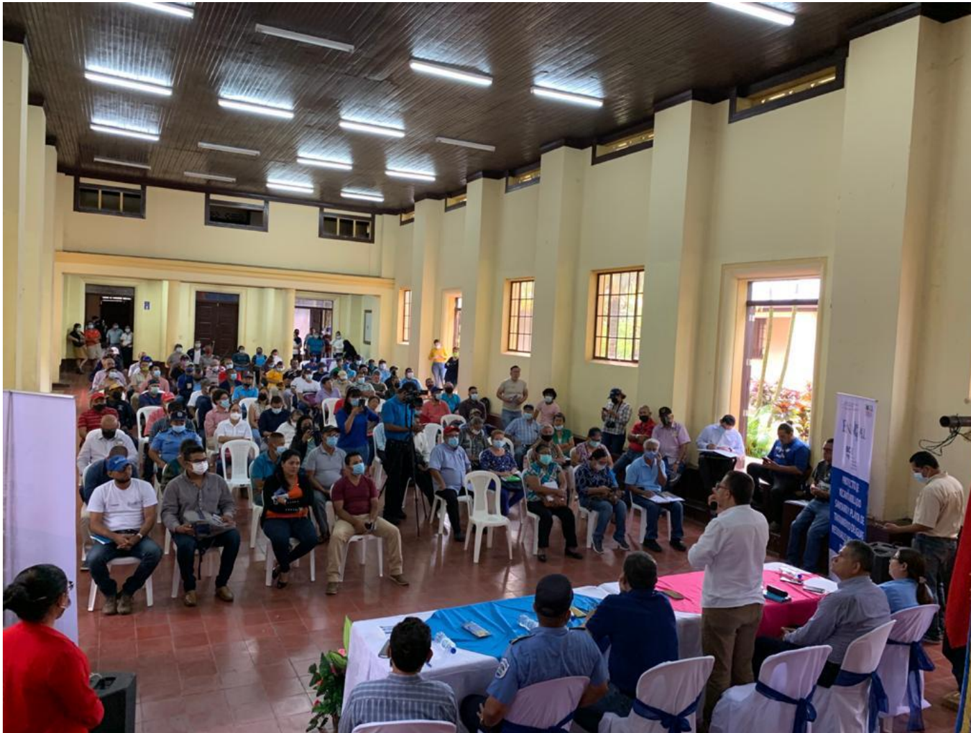
Entrega de Sitio Proyecto de Saneamiento Jinotepe