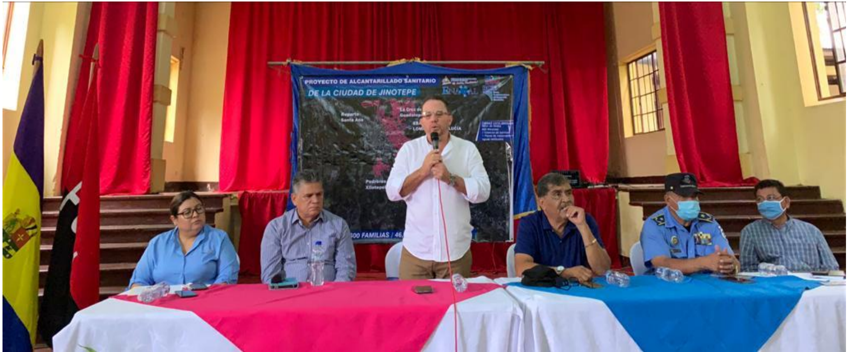
Entrega de Sitio Proyecto de Saneamiento Jinotepe.