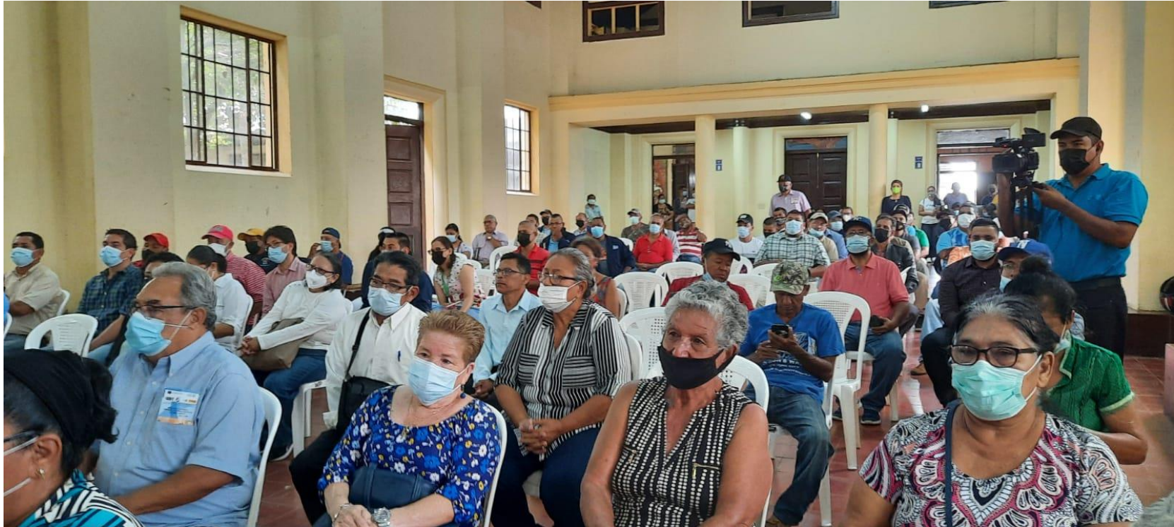
Entrega de Sitio Proyecto de Saneamiento Jinotepe.