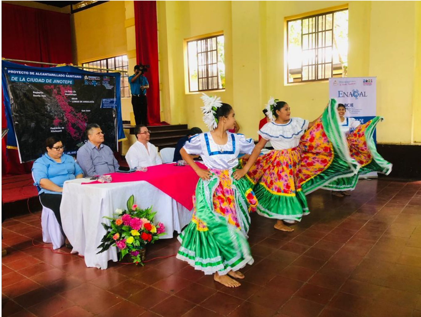
Entrega de Sitio Proyecto de Saneamiento Jinotepe