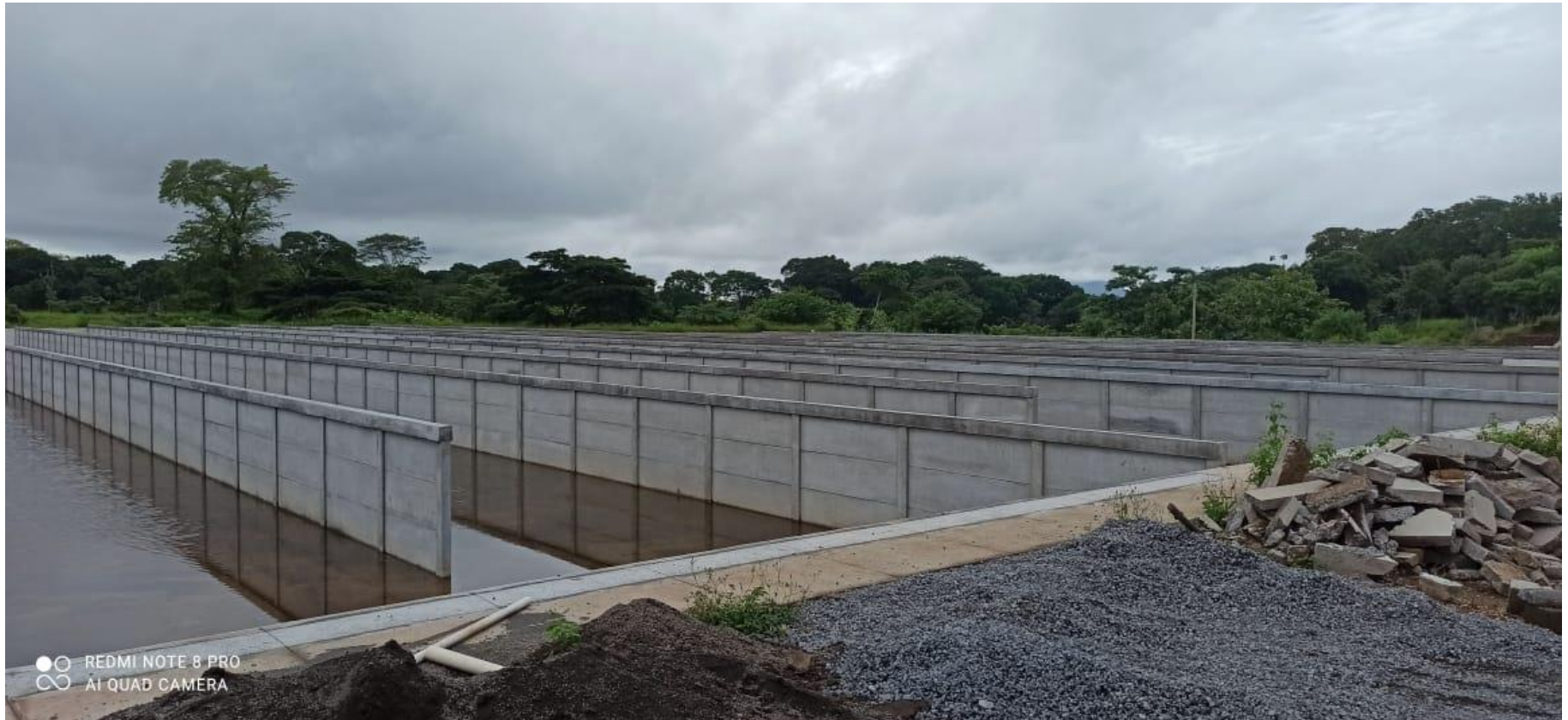
Construcción Planta de Tratamiento de Aguas Residuales.