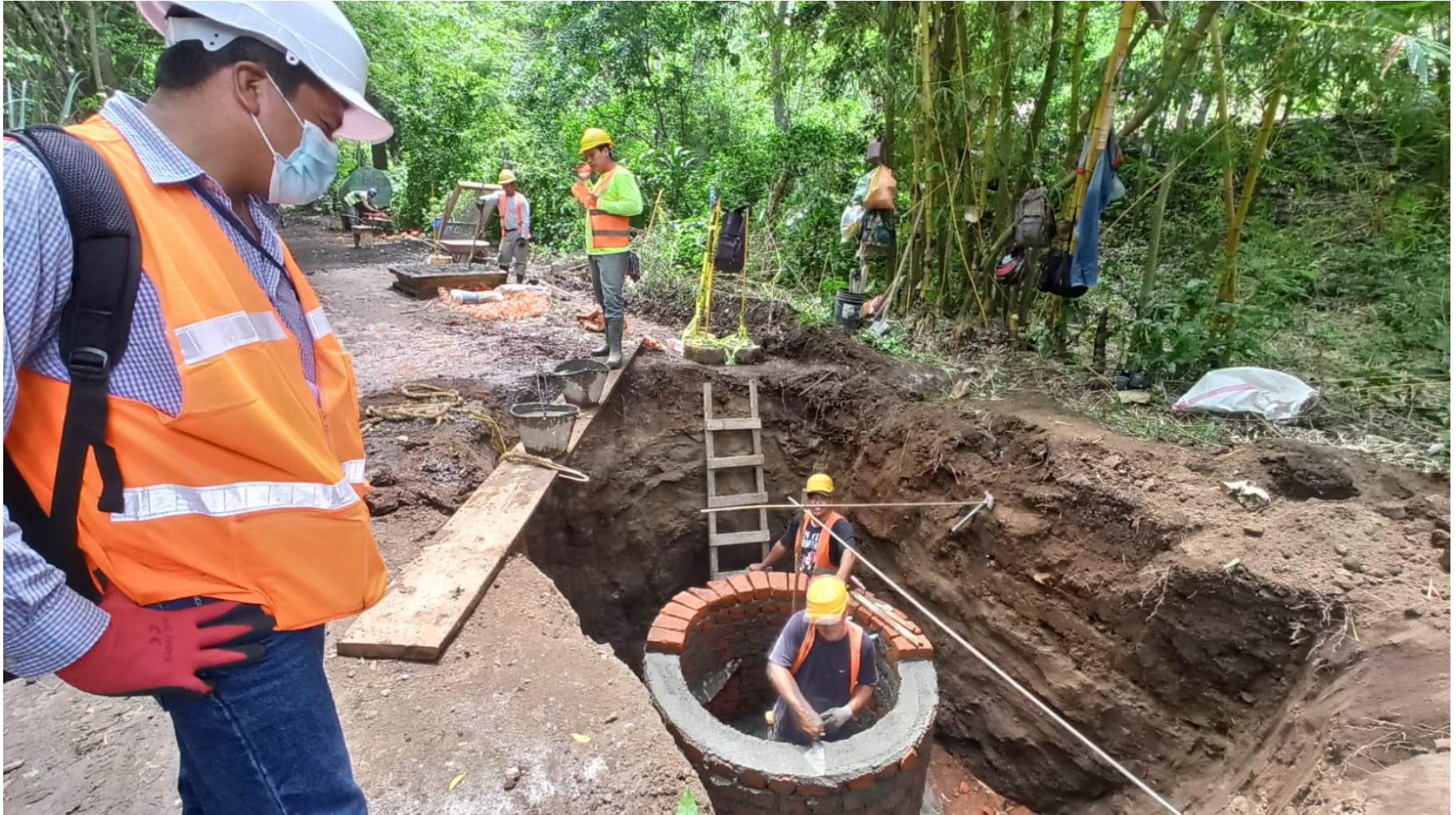
Construcción de 332 manholes.