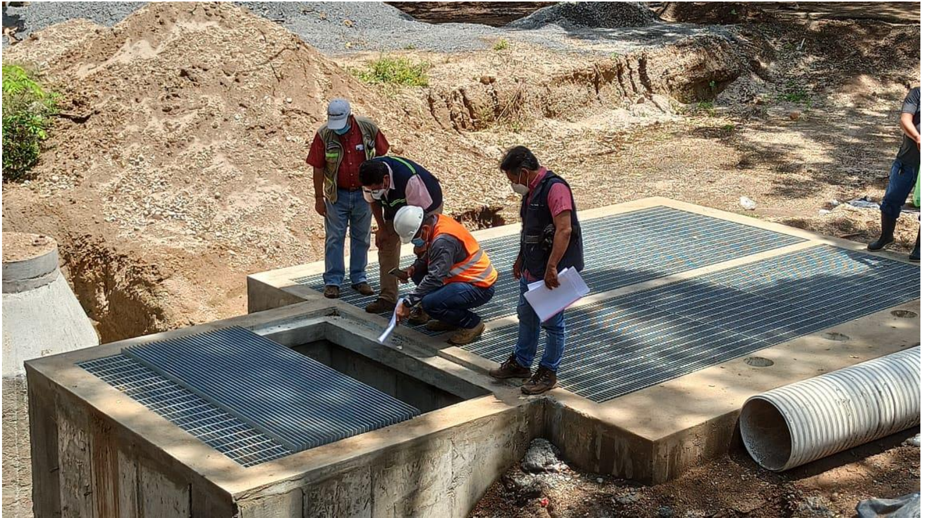
Construcción estación de bombeo de aguas residuales.