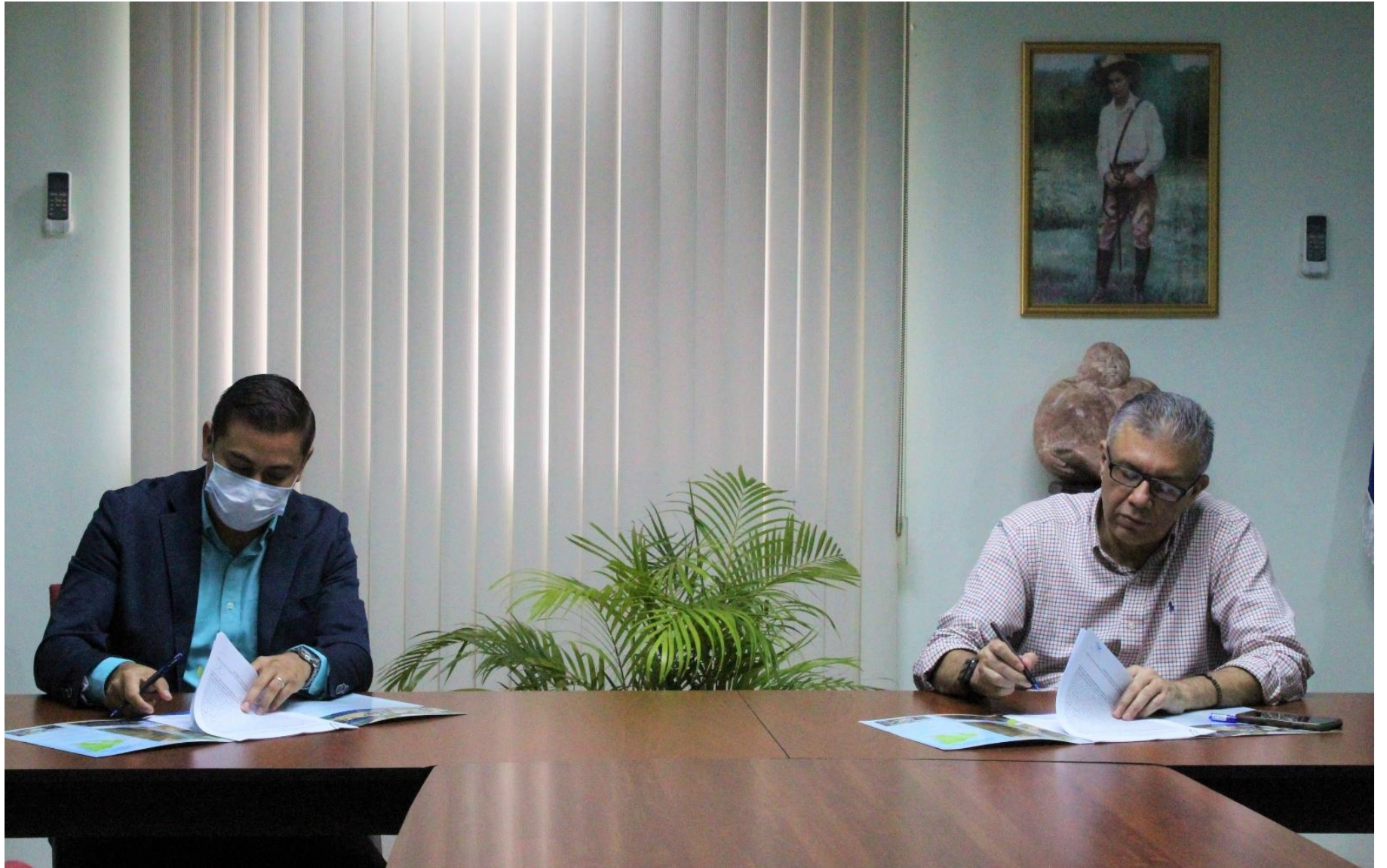
Firma del Contrato de Supervisión.